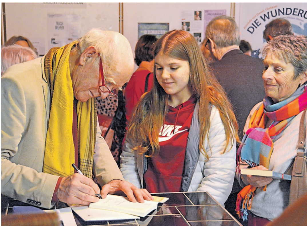
Ein Star zum Anfassen – Hohler signiert in der Pause und nach der Vorstellung Bücher.